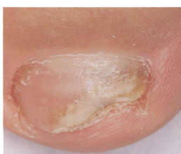
Vor der Behandlung