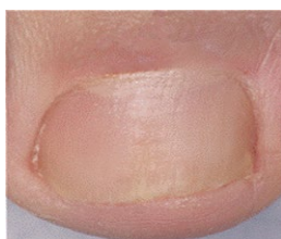
Nach der Behandlung